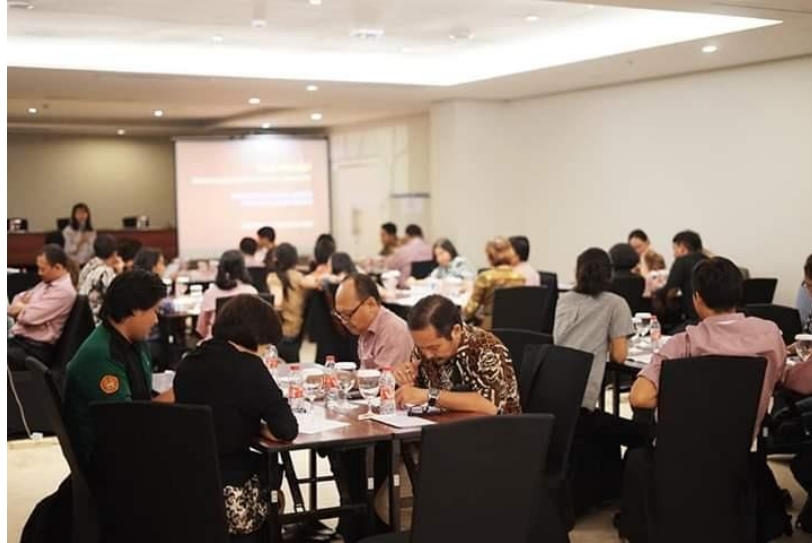
Gambar 6. Kegiatan refleksi karya bersama, dosen, tenaga kependidikan, dan mahasiswa FF USD