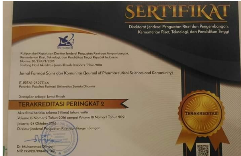
Gambar 4. Sertifikat akreditasi JFSK sinta Ristekdikti peringkat 2