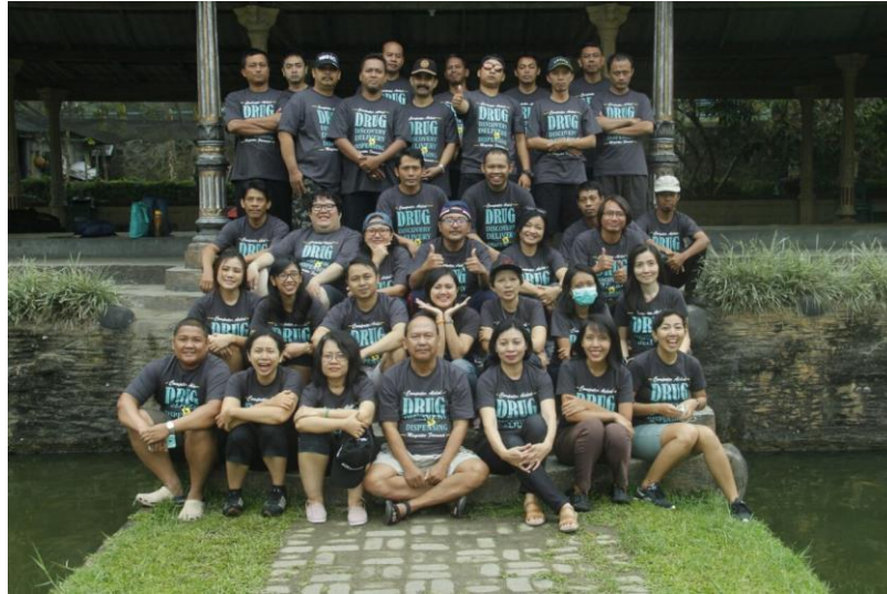
Gambar 3. Kegiatan keakraban dosen dan tenaga kependidikan FF USD

Kinerja tri dharma dosen FF USD dapat diukur salah satunya dari indikator ketepatan lulus mahasiswa, IPK lulusan, dan waktu tunggu lulusan untuk bekerja; sejauh ini performa lulusan FF USD sangat baik. Hal ini dikonfirmasi oleh para mitra FF USD utamanya pengguna lulusan. Beberapa institusi memberi penghargaan, beasiswa, dan bentuk apresiasi lain sebagai wujud kepuasan mereka terhadap kinerja lulusan FF USD.