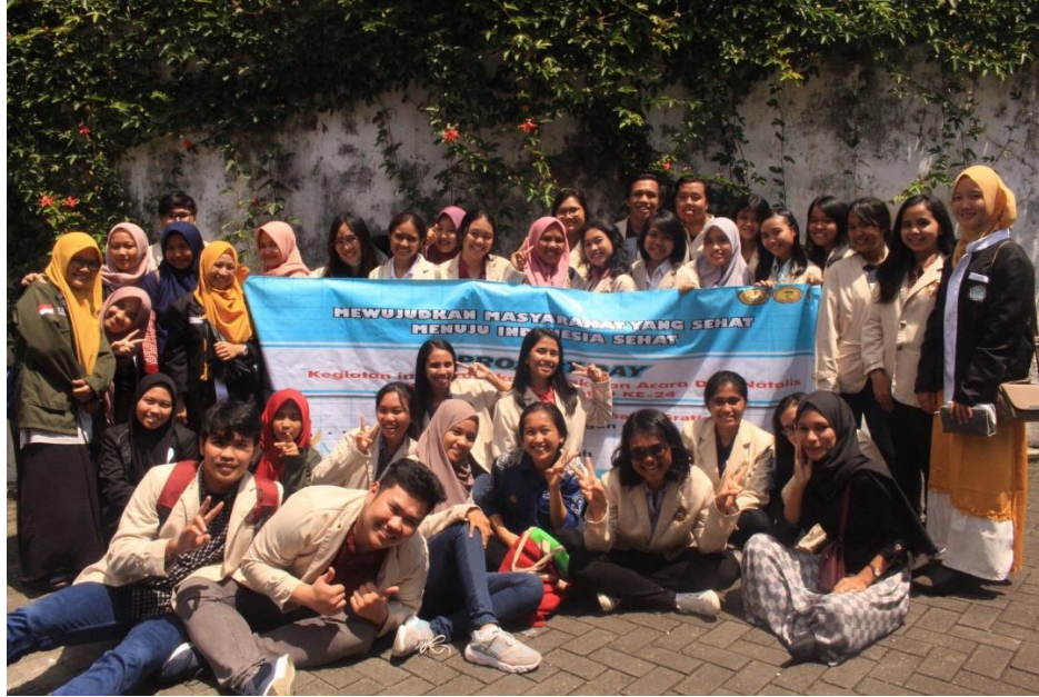
Gambar 2. Mahasiswa FF USD berkolaborasi bersama mahasiswa kesehatan bidang lain melakukan Pengabdian kepada Masyarakat bersama-sama