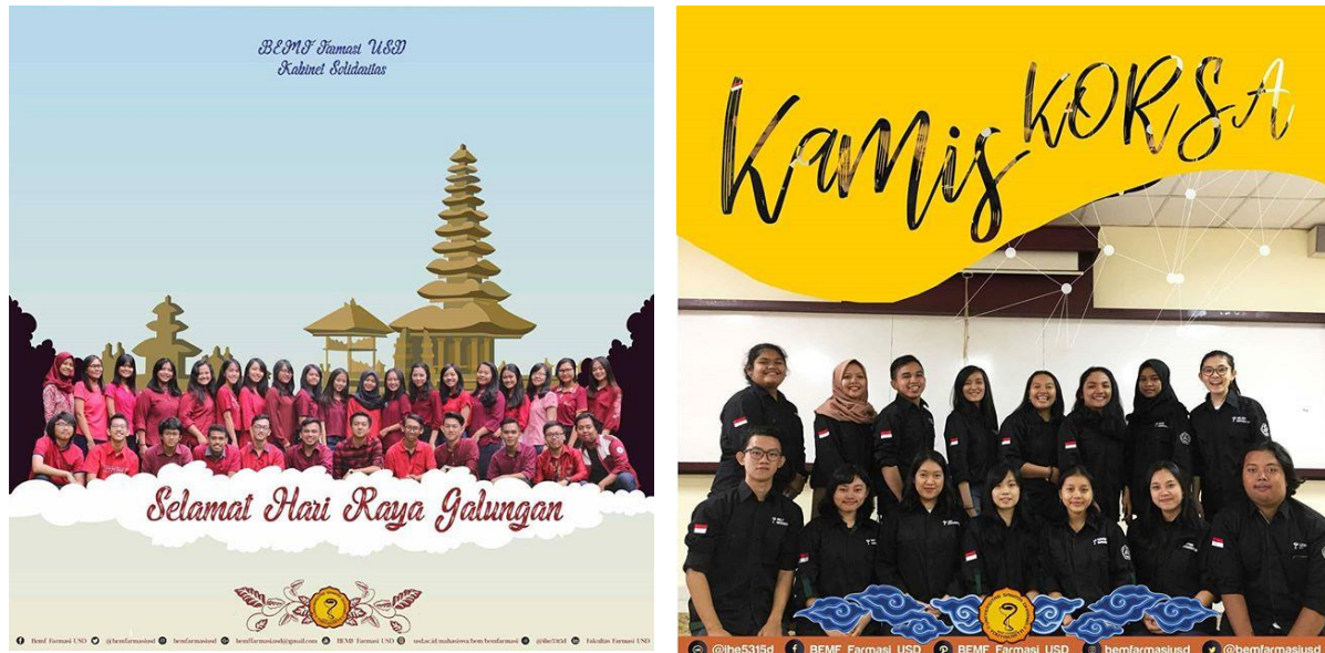
Gambar 1. Mahasiswa Fakultas Farmasi USD

FF USD, sedangkan untuk Faction yang telah dilaksanakan sejak tahun 2016, target kegiatan untuk masyarakat umum/luar FF USD. Selain kegiatan di dalam kampus USD, berbagai kegiatan kompetisi baik lokal, nasional, maupun internasional juga telah diikuti oleh mahasiswa. Sebanyak 33 event kegiatan yang melibatkan 55 mahasiswa telah diikuti/diraih mahasiswa FF USD dari berbagai angkatan ( Tabel 2 dan Tabel 3 ). (Renstra 2019-2023 strategi 1.3).